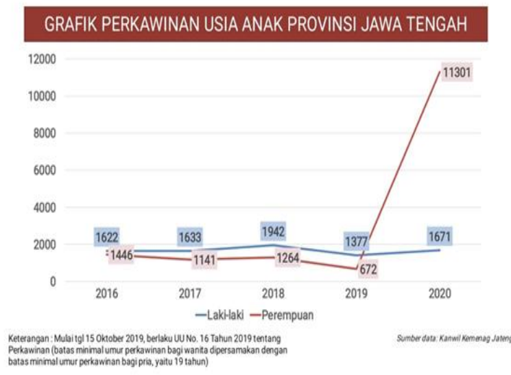
Gambar 1. Grafik Perkawinan Anak Provinsi Jawa Tengah

Sejalan dengan hal tersebut, berikut disajikan data perkawinan anak di Provinsi Jawa Tengah, Indonesia pada interval tahun 2016 sampai dengan tahun 2020.