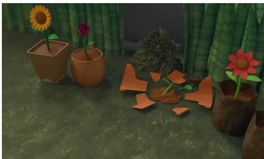
Gambar 3. Tanaman peliharaan Wulan rusak

Adegan berlanjut dengan menampilkan Rico dan Q110 yang sedang asyik bermain bola di halaman depan rumah, sementara tak jauh dari mereka terdapat Wulan yang sangat antusias dengan tanaman peliharaannya yang mulai berbunga. Di saat Rico dan Q110 bermain bola, Wulan menitip pesan agar main bolanya yang hati-hati jangan sampai bola mengenai tanamannya. Namun terjadi kejadian yang tak terduga, bola yang ditendang Rico tak mampu ditangkap oleh Q110 dan bola tersebut memantul dan mengenai tanaman peliharaan Wulan. Pot bunga dan tanaman peliharaan Wulan pun menjadi rusak. Wulan pun sedih atas kecerobohan Rico yang tidak hati-hati. Menyadari kesalahannya, Rico meminta maaf kepada Wulan dan berjanji akan mengganti tanaman yang dirusaknya. Wulan tak menggubris permohonan maaf dari Rico dan pergi berlalu meninggalkan Rico dan Q110. Pada peristiwa inilah cerita mencapai klimaks atau tahap tengah.