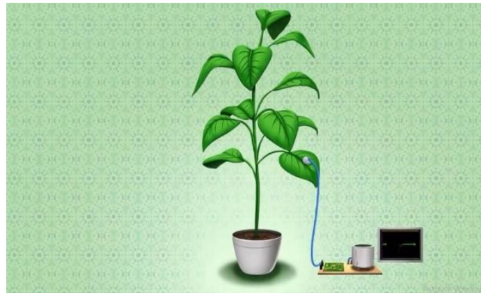
Gambar 4. Penjelasan Q110 kepada Riko tentang tanaman

kali per detik. Penemuan tersebut sesuai dengan penjelasan QS. al-Isra ayat 44. Demikian penjelasan Q110 yang kemudian direspon oleh Riko dengan berujar “Masya Allah”. Lalu Q110 menambahkan bahwa kita harus menjaga dan merawat tanaman sebab tanaman adalah ciptaan Allah swt yang setiap saat bertasbih kepada-Nya. Riko pun akhirnya menyadari mengapa Wulan sedih ketika tanamannya rusak.