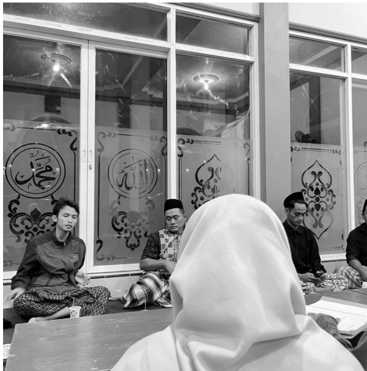
Gambar 2 Observasi dengan pemuda terkait pembuatan konten

Pada tahap ini, dilakukan observasi langsung dan dialog informal dengan pemuda, tokoh agama, serta tokoh masyarakat Dusun Kempul. Ditemukan sejumlah aset yang potensial untuk dikembangkan, seperti semangat gotong royong pemuda dalam kegiatan masjid, keaktifan mereka dalam penggunaan media sosial, serta keberadaan perangkat digital pribadi (seperti smartpone dan laptop) yang memungkinkan produksi konten dakwah sederhana. Selain itu, terdapat kebiasaan masyarakat mengikuti kajian mingguan dan tradisi pengajian keliling yang memperlihatkan potensi keberlanjutan dakwah berbasis komunitas (Ceptureanu, Ceptureanu, Luchian, & Luchian, 2018).