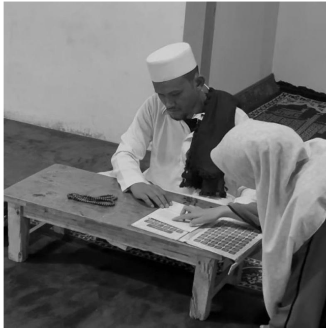
Gambar 3 Pelatihan bersama menyusun program

Selain pelatihan teori, program ini juga menekankan pada praktik langsung. Para peserta diberi tugas membuat video dakwah bertema shodaqoh yang dikemas dengan nuansa humor. Pendekatan ini bertujuan untuk menghadirkan dakwah yang segar dan menghibur tanpa mengurangi kekuatan pesan yang ingin disampaikan. Dalam pelaksanaannya, salah satu peserta diberi peran khusus sebagai "pencair suasana", yakni membawakan humor ringan di sela-sela penyampaian dakwah. Kehadiran unsur humor ini terbukti efektif dalam menarik perhatian audiens serta memperkuat penerimaan terhadap pesan dakwah.