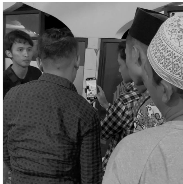
Gambar 4 Contoh Pengambilan Gambar