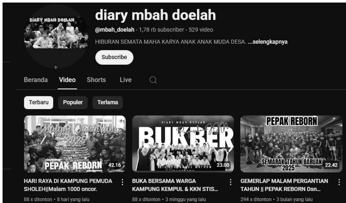
Gambar 6 Akun youtube pemuda Dusun Kempul

Dengan demikian, implementasi program pada tahap Destiny ini tidak hanya berhasil dalam melatih keterampilan dakwah digital, tetapi juga menginspirasi terbentuknya wadah dakwah yang lebih mandiri dan berkelanjutan. Hal ini menjadi bukti bahwa pemberdayaan pemuda melalui pendekatan kreatif dan berbasis teknologi dapat memberikan dampak yang signifikan terhadap perkembangan dakwah di era digital, sekaligus mempererat ikatan sosial dalam komunitas.