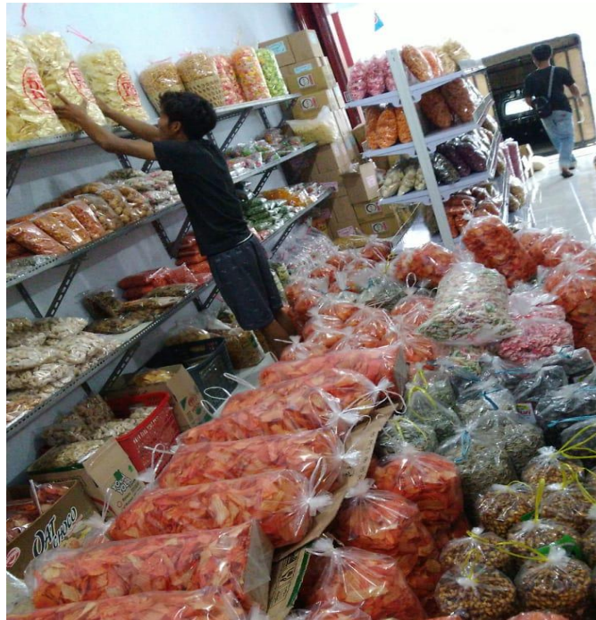
Gambar 3 Proses Pendistribusian Produk