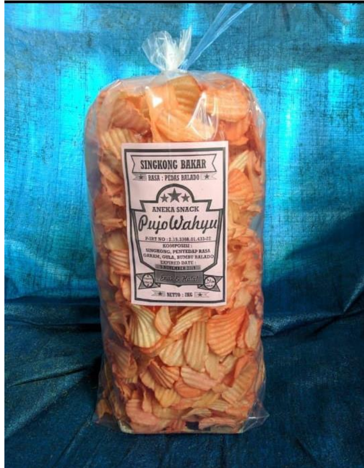
Gambar 2. Brand atau Label pada Kemasan Produk

Produk UMKM tersebut sebelumnya hanya dikemas tanpa disertakan label atau brand . Biasanya produk tersebut dibeli oleh pengepul untuk dikemas dan dijual kembali. Oleh karena itu, pengabdian dalam melaksanakan kegiatan pengabdian ini berupaya membuat sebuah label atau brand yang nantinya akan ditempel pada kemasan produk makanan ringan tersebut.