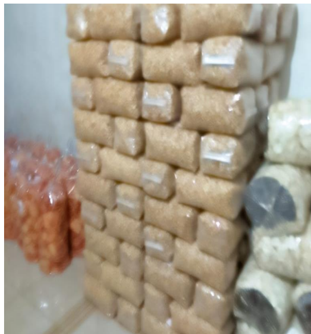
Gambar 4 Pengemasan Produk