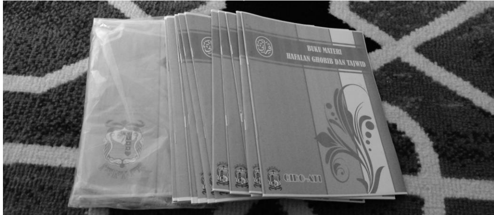
Gambar 2. Buku yang dibutuhkan untuk pengajar Al-Qur'an

Gambar tersebut merupakan wawancara bersama bapak Roqib beliau sebagai pengasuh TPQ Sapu Jagad. Wawancara ini membahas tentang metode sorogan untuk peningkatan membaca Al-Qur'an anak-anak dan membahas bagaimana sistem program yang berjalan untuk kedepan jangka panjang.