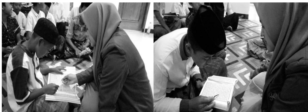
Gambar 11. Sorogan Al-Qur'an

Gambar tersebut merupakan pengenalan makharijul huruf dengan anak-anak yang mengaji Al-Qur'an, peneliti memberikan pengenalan huruf hijaiyah dan pelafalan huruf hijaiyah dengan benar.