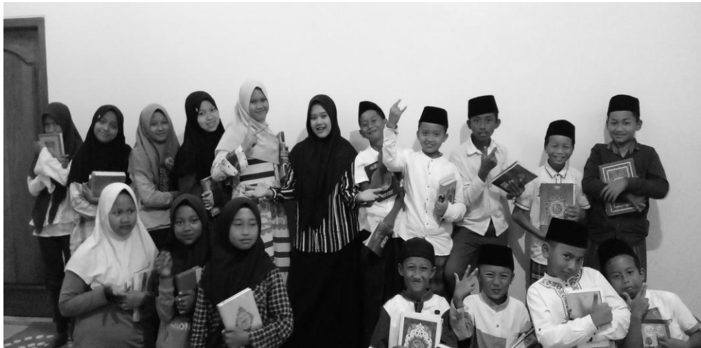
Gambar 4. Anak-anak yang mengaji Al-Qur'an di TPQ Sapu Jagad

menemukan kendala yang ada di TPQ Sapu Jagad. Dalam TPQ ini bapak Roqib mengajar dan mengelola TPQ sendiri, dari sini beliau merasa kurang waktu dan kurang maksimal untuk mengajar, terutama dalam pembelajaran Al-Qur'an. Metode sorogan yang di terapkan oleh beliau masih kurang untuk pengetahuan ilmu tajwid dan penerapan makharijul huruf (Roqib, 2021). Hasil dari wawancara yang dilakukan dapat disimpulkan bahwa dengan metode sorogan yang diterapkan beliau untuk pengajaran Al-Qur'an masih kurang memadai untuk pengetahuan ilmu tajwid dan penerapan makharijul huruf dalam pembelajaran Al-Qur'an. Melihat kekurangan yang ada di TPQ Sapu Jagad pemilik TPQ berharap bisa mendapatkan pengajar tambahan untuk memaksimalkan waktu dalam pengajaran sistem sorogan Al-Qur'an dan mempunyai harapan untuk waktu jangka panjang TPQ Sapu Jagad ini bisa menjadi Madrasah Diniyah yang di bagi perkelas mulai dari anak TK, SD, SMP dan SMA, dan juga yang sudah lulus sekolah untuk tingkat tertinggi mengaji kitab.