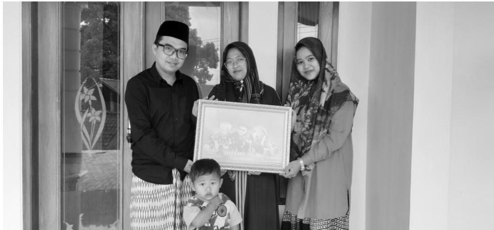
Gambar 14. Foto bersama pengasuh TPQ Sapu Jagad

Gambar tersebut merupakan penyerahan kenang-kenangan dari peneliti untuk pemilik TPQ Sapu Jagad berupa figura foto TPQ Sapu Jagad, pen ini bersama dengan pengasuh TPQ dan anak-anak TPQ Sapu Jagad, penyerahan ini sebagai tanda terimakasih peneliti memberikan untuk TPQ Sapu Jagad karena sudah diterima dengan baik ditempat tersebut.