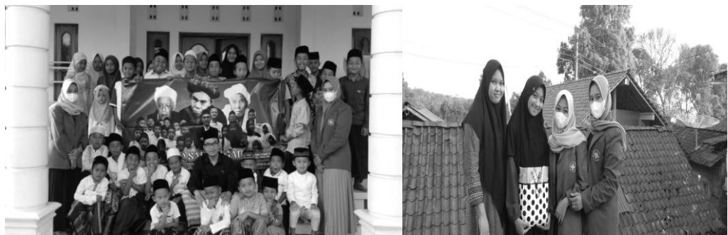
Gambar 13. Penutupan Kegiatan Pengabdian

Gambar tersebut merupakan penutup, sebelum berdoa setelah belajar, anak-anak bersholawat bersama untuk membiasakan anak-anak gemar bersholawat. Anak-anak sangat antusias dalam bersholawat bersama membuat peneliti semakin bersemangat dalam mengajar setiap harinya.