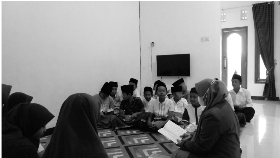
Gambar 10. Pengenalan makharijul huruf

bertugas membenarkan bacaan yang anak tidak bisa membaca. Berusaha memahami anak dengan bertanya, memberikan kode, mengingatkan agar anak tidak takut saat sorogan. Pengajar juga harus memberikan kode, peringatan, menekankan pada bacaan yang di baca anak. Selain itu juga mengulang kembali pada huruf-huruf yang ditekankan agar anak lebih mudah untuk menghafal huruf tersebut. Pada kegiatan akhir sorogan setelah seluruh anak selesai sorogan, anak duduk di tempat kursi masing-masing atau duduk melingkar di karpet. Kegiatan dilanjutkan dengan kegiatan akhir.