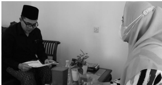
Gambar 1. Wawancara oleh pengasuh TPQ Sapu Jagad

Pendampingan yang dilakukan di desa Pakis tepatnya di TPQ Sapu Jagad dimulai dengan wawancara terlebih dahulu oleh pengasuh TPQ Sapu Jagad dan dengan pihak-pihak desa seperti warga, kepala dusun dan ketua RT. Wawancara tersebut mendapatkan data bahwa TPQ Sapu Jagad ini dikelola oleh satu keluarga. TPQ ini sudah memiliki kemajuan namun masih belum memenuhi kebutuhan TPQ karena metode sorogan yang diterapkan di tempat tersebut belum tertata dengan rapi dan sarana prasarana nya juga belum memadai.