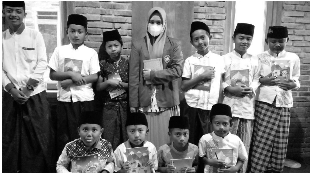
Gambar 5. Pembagian buku tulis kepada anak TPQ Sapu Jagad

Gambar tersebut merupakan pembagian buku tulis untuk anak-anak TPQ Sapu Jagad sebagai sarana dan prasarana kebutuhan anak-anak untuk menulis materi yang disampaikan oleh pengajar, tujuannya adalah ketika anak lupa dengan materi yang disampaikan, mereka masih mempunyai catatan pada buku tersebut.