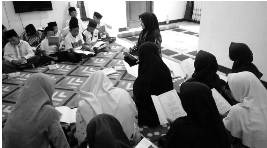
Gambar 12. Penutup sholawat bersama

Kegiatan akhir ini dilakukan dengan posisi duduk melingkar atau duduk di kursi anak masing-masing. Bacaan doa penutup kegiatan sorogan. Setelah selesai membaca doa penutup tersebut, anak-anak mulai merapikan alat-alat tulisnya secara bersama-sama dan dilanjutkan untuk kegiatan akhir pembelajaran, dan kegiatan penerapan metode sorogan selesai.