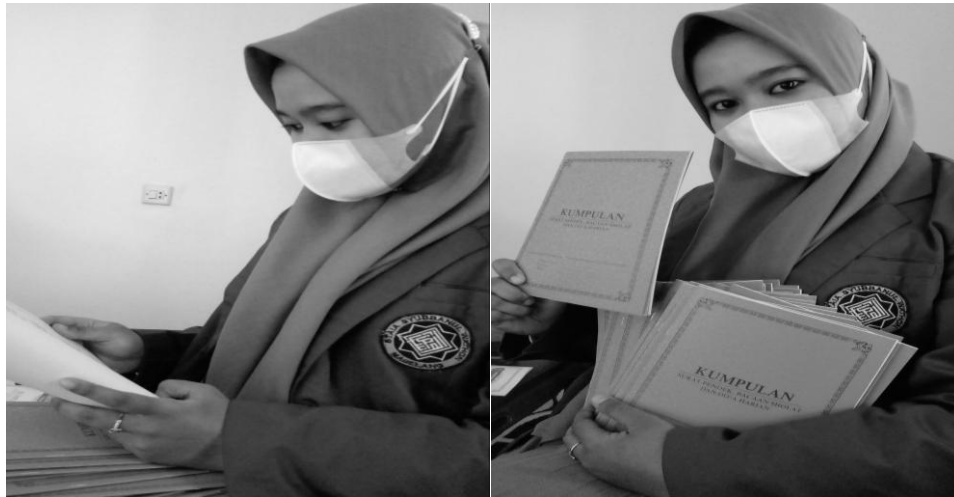
Gambar 7. Buku Panduan membaca Al-Qur'an

Gambar tersebut merupakan buku ringkasan sebagai panduan yang di buat oleh peneliti yang akan digunakan sebagai panduan mengajar Al-Qur'an dengan metode sorogan. Dimana isi nya terdapat bacaan tajwid, ghorib, makharijul huruf dan kumpulan doa-doa kegiatan yang dilakukan setiap hari.