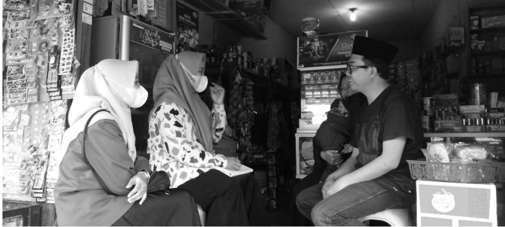
Gambar 8. FGD di TPQ Sapu Jagad

Gambar tersebut merupakan forum diskusi antara peneliti dan pengelola TPQ Sapu Jagad bertempat pada warung yang dimiliki oleh bapak Roqib, forum diskusi ini untuk peningkatan kemampuan membaca Al-Qur'an melalui pengenalan makharijul huruf menggunakan metode sorogan.