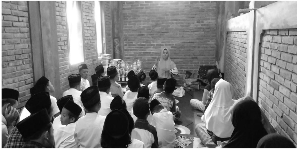
Gambar 9. Pertemuan pertama di TPQ Sapu Jagad

Gambar tersebut merupakan pertemuan pertama dengan seluruh anak-anak mulai dari anak TK, SD, SMP, SMA, dan yang sudah lulus sekolah di TPQ Sapu Jagad, pertemuan pertama ini untuk pengenalan diri dan cerita berbagi pengalaman yang dimiliki oleh peneliti.