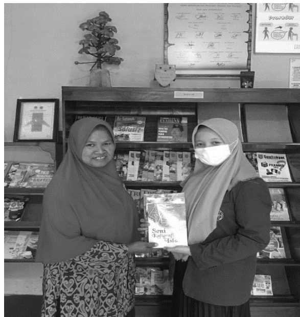
Gambar 2. Penyerahan Donasi Buku Seni Kaligrafi Islam

Aksi inti kedua melibatkan metode pembelajaran praktik yang lebih menyenangkan, yaitu Praktik Mewarnai Kaligrafi. Metode ini dipilih sebagai cara pengenalan seni kaligrafi secara langsung dan efektif bagi anak usia dini. Praktik mewarnai membantu peserta untuk berinteraksi secara fisik dengan bentuk-bentuk huruf Arab artistik, sekaligus melatih koordinasi motorik halus dan pengenalan